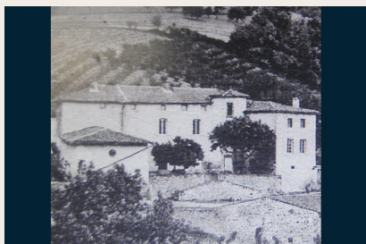
Le château de Charfetaïn