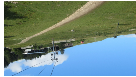
depuis une cabine, vue sur la gare supérieure de la Catheline / Lèlex