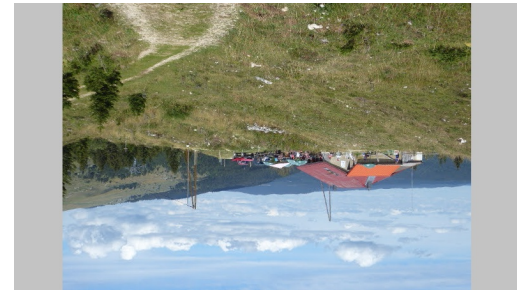
photo prise en amont du Refuge de La Loge