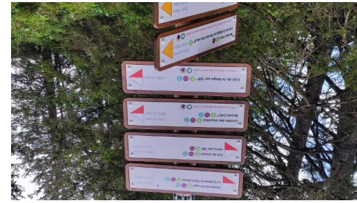
ici, suivre le GR9 par Combe des Voyettes, Grand Crêt.