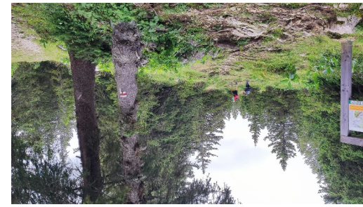
Brillones den Haut - 1455 m d'alt - suivre Crêt de la Neige par GR. ... le sentier.

Photo de couverture: panorama sur les Alpes depuis le Crêt de la Neige. ©IGN Données cartographiques: Cartographie d'Outdooractive; @OpenStreetMap (www.openstreetmap.org)