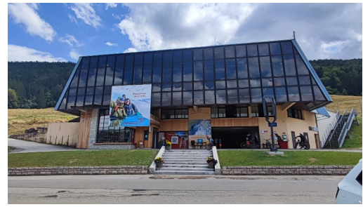
la gare inférieure des télécabines (la Catheline) à Lèlex

Point d'arrivée de l'activité Arrivée de la télécabine de la Catheline