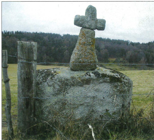
Croix de granite vers Oyex

Une partie du circuit traverse la forêt d'OYEX, celle-ci, bien que gérée par l'ONF est une forêt sectionnale : cela signifie qu'elle appartient à la collectivité villageoise. Ce statut forestier, lointain héritier des droits d'usages concédés au cours du Moyen-Age par les seigneurs, est encore répandu dans la région comme dans tout le Massif Central. Il permettait aux habitants permanents du village (il fallait que la cheminée fume six mois et un jour par an) de pouvoir s'approvisionner en bois de consommation pour le chauffage, la construction ou l'outillage agricole une part était toujours réservée pour l'école. Aujourd'hui encore, la population reste très attachée à ce droit collectif.