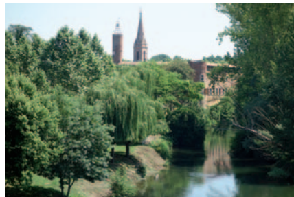
Aire de détente aménagée en bordure d'Aveyron