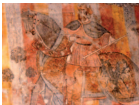
Peintures murales ornant la salle des Chevaliers