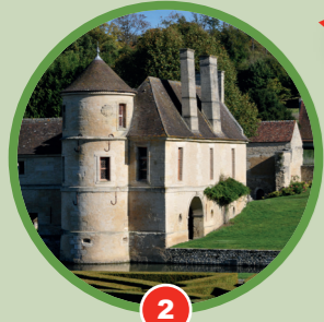
2 Le pavillon de Ninon