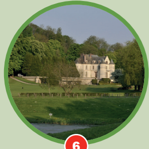
6 La terrasse de la Vinette