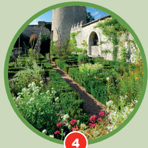
4 La terrasse médiévale