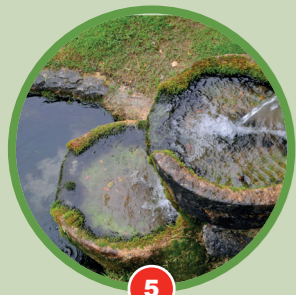
5 La fontaine de jouvence