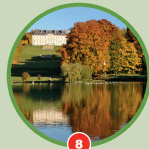
8 Perspective sur le château du Haut