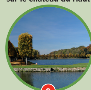
9 Allée de promenade longeant l'étang