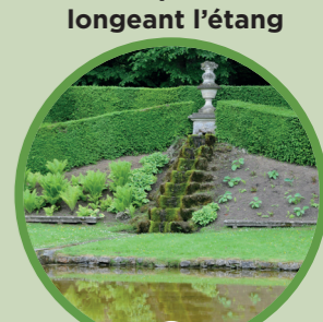
10 La cascade et le miroir de Ninon