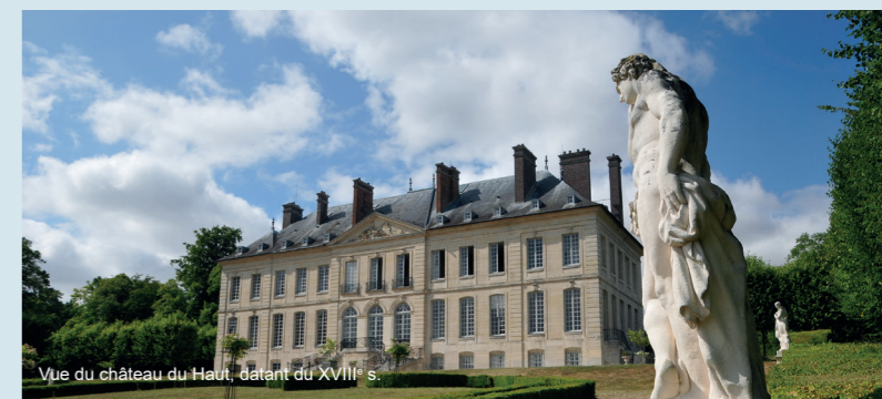
Vue du château du Haut, datant du XVIII e s.

À l'issue de votre visite, sortez par le petit boudoir et regagnez l'accueil en redescendant le vertugadin.