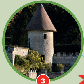
3 La tour Saint-Nicolas