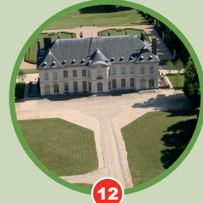
12 La cour d'honneur du château