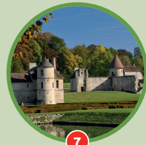
7 Vue sur le manoir et le hameau de Villarceaux