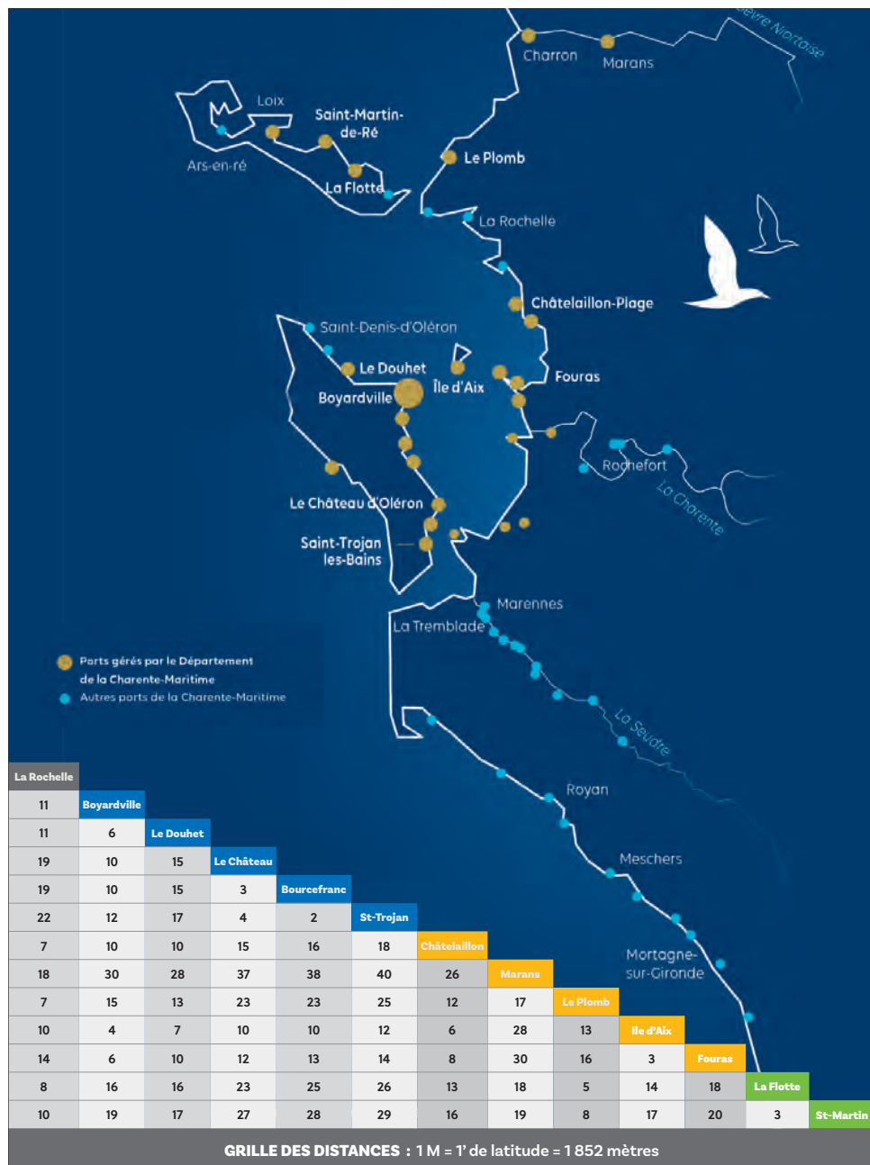
GRILLE DES DISTANCES : 1 M = 1' de latitude = 1 852 mètres