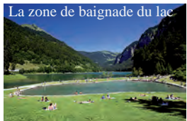
La zone de baignade du lac

Chaque 1er samedi du mois d'août, Montriond organise les "Feux du lac", un spectacle son et lumière gratuit.