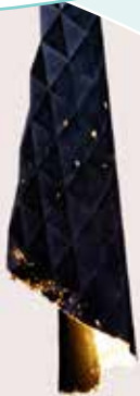
Emilie Griere SILICONE