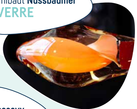
Thibaut Nussbaumer VERRE