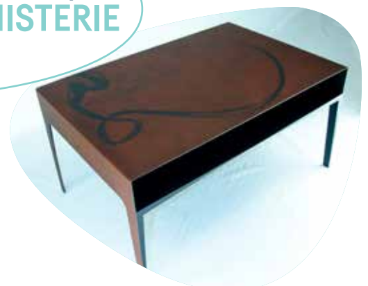
Romuald Fleury ÉBÉNISTERIE