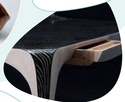
Bruno De Maistre ÉBÉNISTERIE