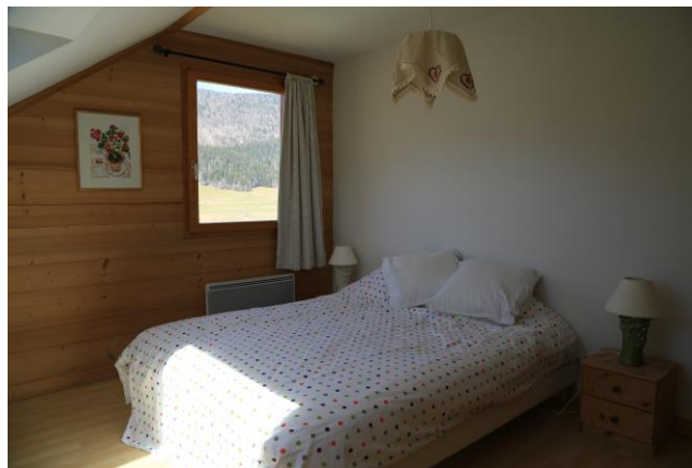
Chambre, 1 lit 160 X 200