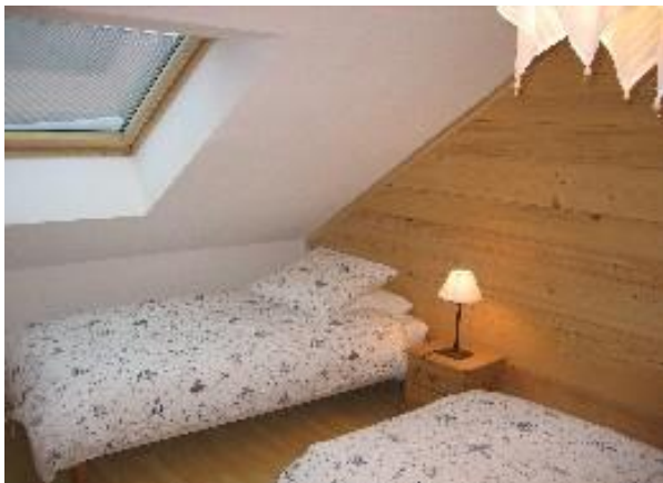
Chambre à 3 lits