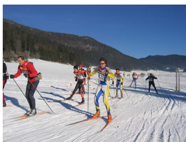
ski de fond