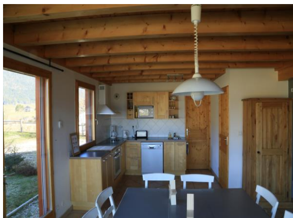
Cuisine tout équipée