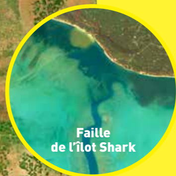
Faille de l'îlot Shark

Ce sentier surplombe la fameuse « faille » de l'îlot Shark, dont la trace étroite, d'un bleu profond, entaille l'eau turquoise du lagon. Cet ancien lit de rivière, d'une profondeur d'environ 20 m, débouche directement sur le large et les grands fonds. Il forme un petit canyon parcouru par de violents courants et est fréquenté par des espèces pélagiques qui font le bonheur des amateurs de plongée.