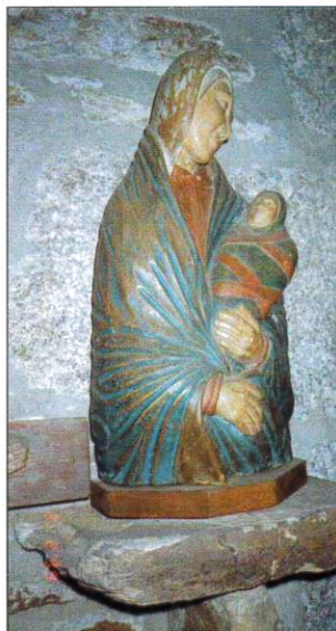
Vierge à l'enfant langé datant du XVIème siècle volée en 2001

Les statues et autres reliques de ces deux églises furent conservées dans la petite "chapelle musée", à l'intérieur de l'église de Fridefont. Hélas un vol ayant été perpétré en 2001 nous ne pouvons plus aujourd'hui les admirer.