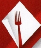
Planche à partager 17€