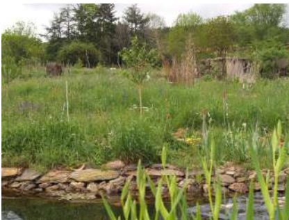
Forêt vivrière au Printemps 2022