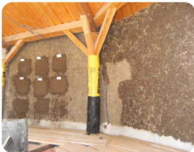
Enduit terre sur paille

Enduit terre sur murs de paille: préparation et mise en place du corps d'enduit, finition et mise en place d'un stuc d'argile pour réalisation d'un écran vidéo sur argile.