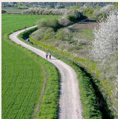
La Rigole Domaniale ou des Granges

Aujourd'hui, si l'eau des Rigoles n'arrive plus jusqu'à Versailles, faute notamment d'entretien sur certains