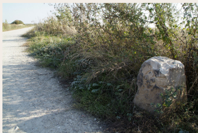
Borne fleurdelysée sur la Rigole Domaniale

Ce circuit est situé non seulement dans le site classé depuis juillet 2000 de la Vallée de la Bièvre, ensemble naturel le plus proche de la capitale, mais aussi dans la Zone de Protection Naturelle, Agricole et Forestière (ZPNFA). Ce dispositif législatif, datant de la loi du Grand Paris de 2010 et unique en France, préserve de l'urbanisation 4 115 ha dont 60 % sont constitués d'exploitations agricoles.