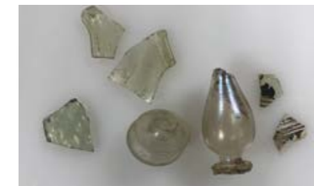
Éléments de verre à tige - Milieu XVI e s. - début XVII e s.