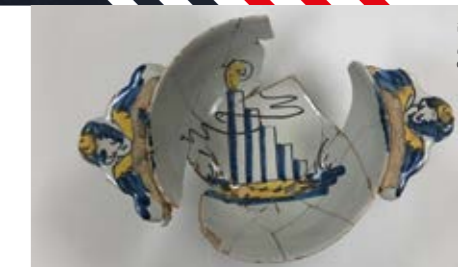
Écuelle à oreilles - Milieu XVI e s. - XVII e s. Coll. Département de la Haute-Savoie