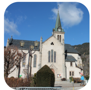
Eglise Sainte-Marie-Madeleine à Praz-sur-Arly