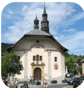
Eglise de Saint-Gervais les Bains