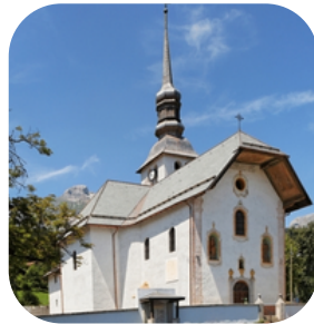
Eglise Notre-Dame de l'Assomption à Gordon