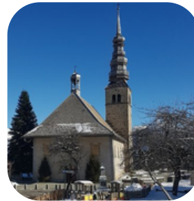
Eglise Saint-Nicolas à Combloux