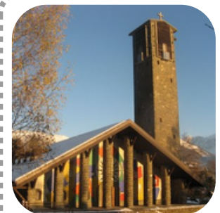
Eglise Notre-Dame de Toute Grâce au plateau d'Assy