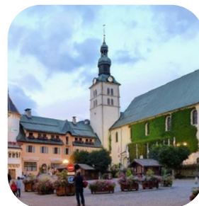
Eglise Saint Jean-Baptiste à Megève