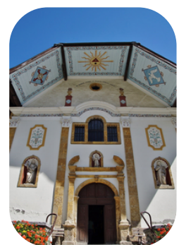
Eglise de la Sainte-Trinité Les Contamines-Montjoie