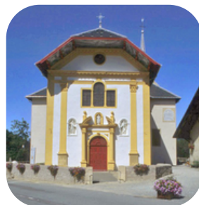
Eglise de Saint-Nicolas de Véroce