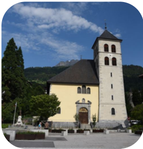
Collégiale Saint-Jacques à Sallanches