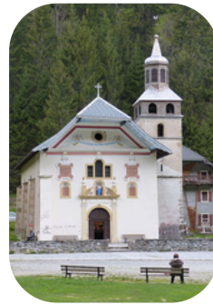
Eglise Notre-Dame-de-la-Gorge Les Contamines-Montjoie

La Haute-Savoie possède un patrimoine religieux exceptionnel, notamment baroque. Il s'est épanoui dans les églises paroissiales, comme dans les plus petites chapelles de montagne. Cet essor du baroque alpin révèle la profusion de l'or et des couleurs, dans cet art nouveau chargé de préfigurer la beauté du paradis. D'autres surprises vous attendent dans un tout autre style architectural à Praz-sur-Arly et au Plateau d'Assy.