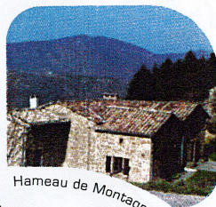
Hameau de Montagnac