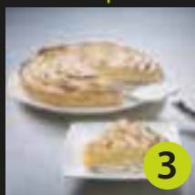
Tarte aux pommes