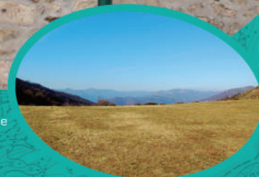
Vue depuis la place Chef lieu