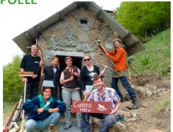
Chantier à Cumina, cabane voisine de Lou Pi

Tous à Poêle est un collectif de montagnards (ou presque) qui apporte du beau, du chaleureux et de l'utile aux cabanes, abris, chalets et refuges libres de montagne. Cette association organise ainsi depuis 2015 des chantiers de bichonnage où travail rime avec ripaille : elle est déjà intervenue sur 18 cabanes situées dans les Alpes et les Pyrénées (Belledonne, Bauges, Baronnies, Écrins, Ventoux, Capcir...). En 2021, l'association a été sollicitée par un élu de Saint-Michel en Beaumont pour intervenir sur deux anciennes cabanes de berger. Après 10 jours de chantier avec des bénévoles de tous horizons - novices de la perceuse, bricoleurs du dimanche et plus expérimentés - les cabanes Lou Pi et Cumina se sont vues offrir une seconde vie avec construction de tables, bancs, étagères, garde-manger, dortoir et installation de différents petits équipements chaleureux et utiles pour le randonneur de passage (livre d'or, carte IGN, fil à linge, balai, etc.). Pour participer aux prochains chantiers : tousapoele.org