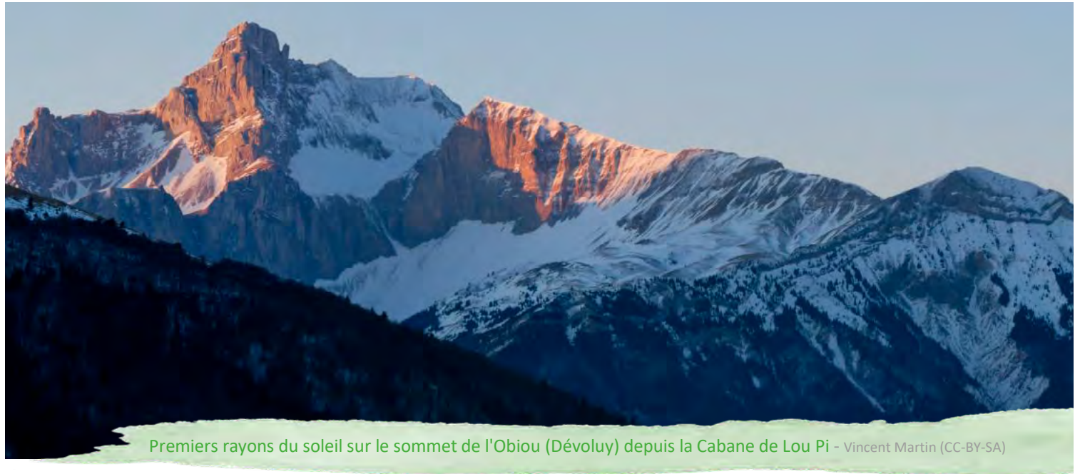
Premiers rayons du soleil sur le sommet de l'Obiou (Dévoluy) depuis la Cabane de Lou Pi