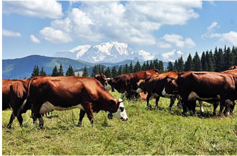
JP Noisillier - nuts.fr

Fabrication, vente en direct de reblochon fermier, tommes et tommettes fermières de montagne, confitures maison. Ouvert tous les jours de 10h30 à 12h00 et de 17h30 à 19h00 sauf le dimanche.