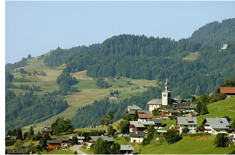
JP Noisillier - nuts.fr

Contact : Téléphone : 04 79 31 73 85 Fax : 04 79 31 79 51 Email : jeanclaude.bouchex73@orange.fr Site web : http://jc.bouchex.free.fr