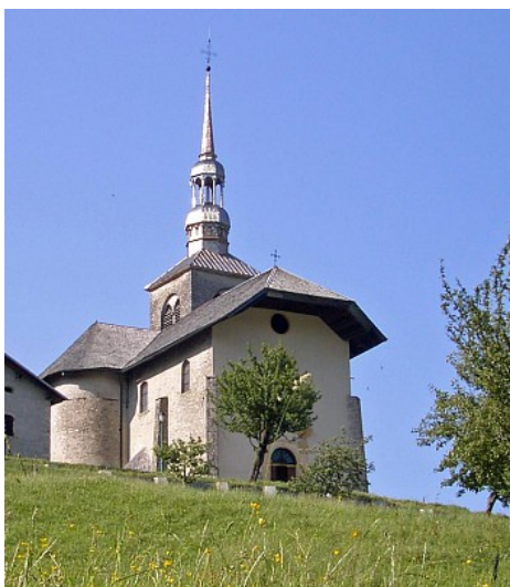
OTI Val d'Arly

Sa qualité architecturale et la richesse de son mobilier valent à cette église d'être inscrite sur l'inventaire supplémentaire des Monuments Historiques en 1989.