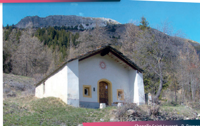
Chapelle Saint-Laurent - R. Bernard

Entendez-vous la cascade du Diet dans votre dos?