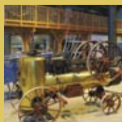
Découverte des machines