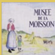
Le musée de la Moisson