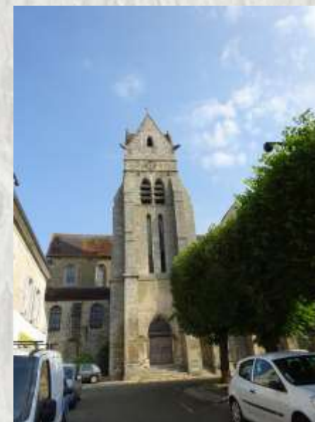
L'Église de Chaumes-en-Brie

Le Vivier, avec ses étangs et les ruines de son château, la vallée de l'Yerres dominée par le viaduc de l'ancienne voie de chemin de fer et, enfin, Chaumes-en-Brie, vous attendent sur ce circuit typiquement briard.