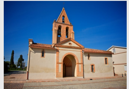
Pujaudran : Eglise du XVIIème siècle possède un clocher mur latéral en brique, d'un type rare dans le Gers. Traversé par le chemin de