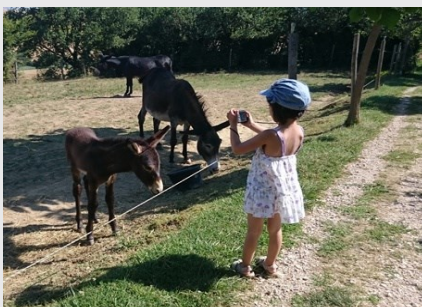
Asinerie d'Embazac : Elevage d'ânesse laitière BIO. Visite du troupeau, traite des ânesses, dégustation du lait, confection des

ot-gascognetoulousaine@orange.fr www.tourisme-gascognetoulousaine.fr