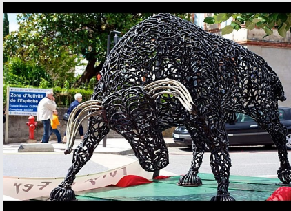
Forge de Fontenilles : Découvrez un métier ancestral ! La forge de Fontenilles est ouverte le samedi matin et sur rdv juillet et août au 06 19 94 94 32