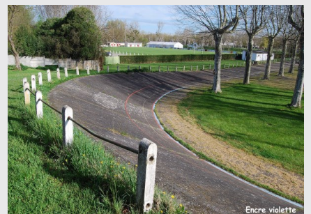
Le vélodrome : dans les années 70, L'Isle-Jourdain accueillait les 1er critériums.