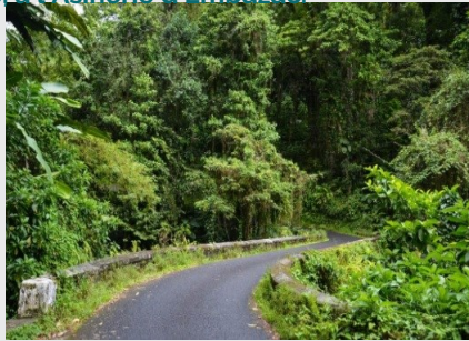
Ancienne route royale de Toulouse : Vous empruntez l'ancienne route royale qui menait les diligences vers Toulouse. La légende

Ce parcours de 29,1 km est destiné aux cyclistes habitués, les pentes sont raides et les sensations fortes mais fun en VAE ! Après les 11 % de la route de Montagne, ancienne route royale de Toulouse, où la légende situe l'attaque des diligences par les bandits..., vous traversez le village de Pujaudran. Vous filez ensuite sur Fontenilles, commune haut-garonnaise de la Gascogne toulousaine. Le retour sur petites routes de campagne traverse Lias et vous mène, pour une halte bien méritée, à l'Asinerie d'Embazac.