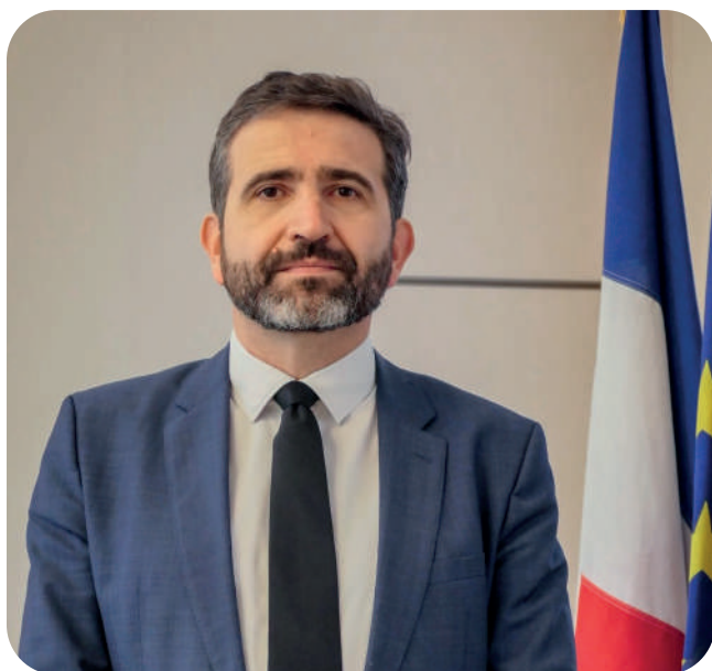
Pascal Courtade Préfet de l'Aube

Puisse cette édition 2026 être, pour toutes celles et ceux qui auront la chance d'y participer, une source d'émotions, d'émerveillement et de découvertes, fidèle à cette pensée de Victor Hugo : « La musique exprime ce qui ne peut être dit et sur quoi il est impossible de rester silencieux. »