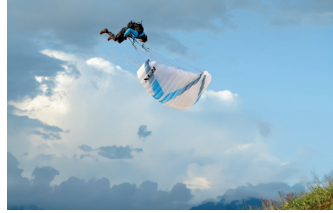
Exploration: Speedriding in the French Alps

Two Professional Speed Pilots showcase their immense skillset and knowledge of the SpeedRiding in the French Alps.