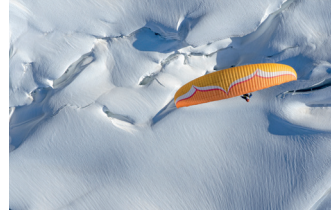
The Magic of Freedom