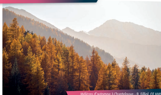
Mélèzes d'automne à Chantelouve

N'en oubliez pas pour autant cette vue dépayssante sur le versant opposé. Les falaises de Vallonbrun sont de toute beauté.