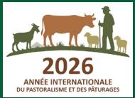
Illustration : Agathe Bonno