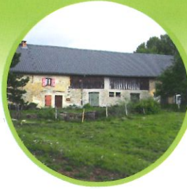
La ferme du Comte