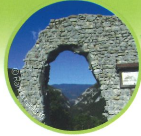
Ruines de la chapelle St André