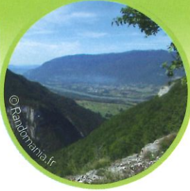
Belvédère Mont des Princes