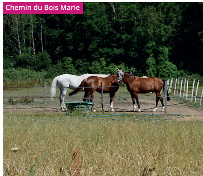
Chemin du Bois Marie