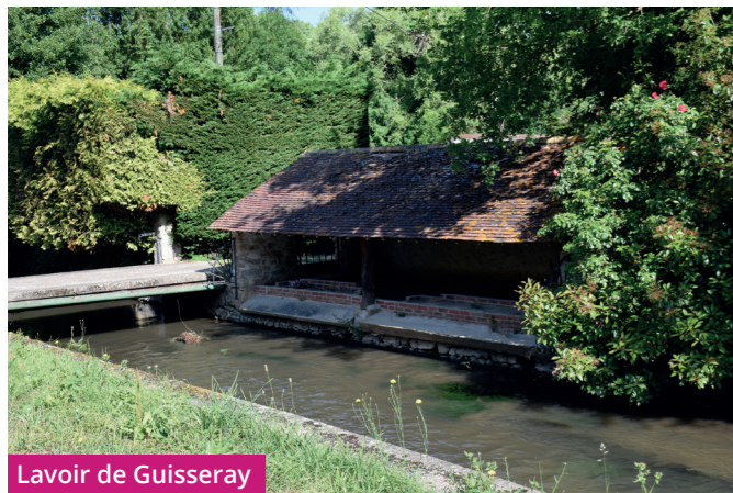
Lavoir de Guisseray

Du centre-ville, prendre la route d'Arpajon , puis la rue Nouvelle au passage à niveau, ne pas traverser le PN29, longer la voie ferrée en direction de la route de Guisseray . Emprunter cette rue sur votre gauche pour rejoindre la route de Saint-Chéron , RD116. Sur le parcours, vous passerez devant les bâtiments de l'ancien Moulin puis le lavoir de Guisseray.