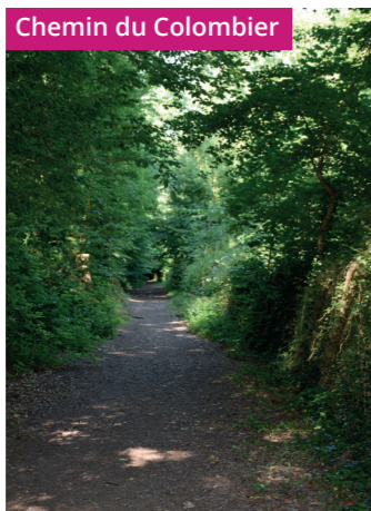
Chemin du Colombier

Continuer à gauche sur la route de Saint-Chéron , RD116, sur une petite centaine de mètres puis tourner sur votre droite, en direction du Parc du Colombier. Emprunter le chemin du Colombier à la Folleville sur tout son long.