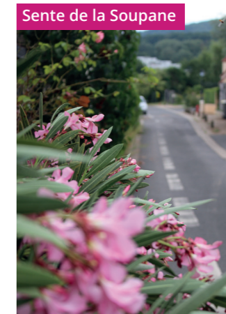
Sente de la Soupane

Traverser la route de Dourdan pour rejoindre la rue du Pont des Gains . Traverser le passage à niveau PN31 et tourner à gauche pour entrer dans le parc Moessner, continuer sur la liaison douce traversant le parc, pour finaliser votre boucle et revenir au centre-ville sur votre gauche.