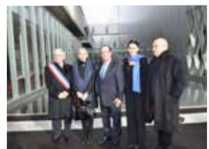
Pose de la première pierre du bâtiment par M. François Fillon.