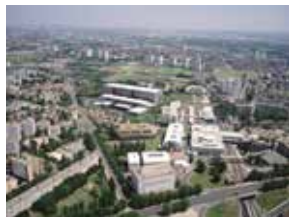
Vue aérienne du site des Archives nationales de Pierrefitte-sur-Seine.

Le bâtiment offre 66 000 m 2 de superficie utile et 320 kilomètres linéaires de magasins d'archives afin d'accueillir les archives des administrations centrales de l'État postérieures à la Révolution française. Les 5 400 m 2 d'espaces publics permettent de recevoir les chercheurs venus consulter les documents, les visiteurs des expositions, les auditeurs des conférences et le jeune public qui bénéficient ainsi de l'expertise, du rayonnement scientifique mais aussi du travail de médiation des Archives nationales.