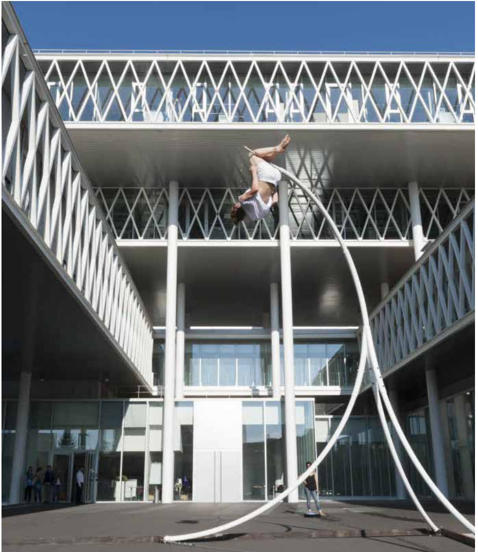
Bâtiment des Archives nationales, architectes M. et D. Fuksas.