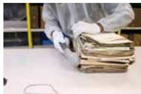
Dépoussiérage des archives avant leur déménagement vers le site de Pierrefitte-sur-Seine.

> le chantier du système d'information archivistique : un nouveau système d'information, commun aux trois sites, a été déployé en 2012. Il permettra, en particulier, une navigation facile et performante entre la consultation des instruments de recherche dématérialisés et la réservation ou la commande de documents.