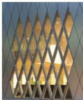
Façade de l'immeuble de grande hauteur [IGH].

Les performances du bâtiment de conservation le placent dans le groupe des bâtiments de conservation les moins énergivores.