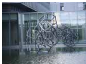
Détail de l'œuvre de Pascal Convert.