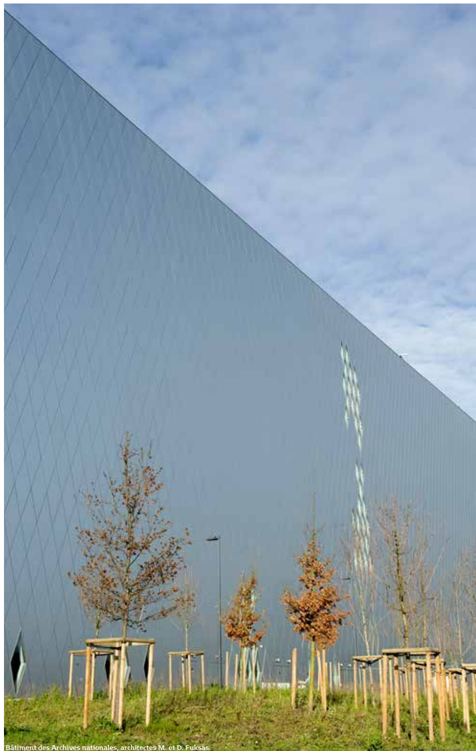
Bâtiment des Archives nationales, architectes M. et D. Fuksas.