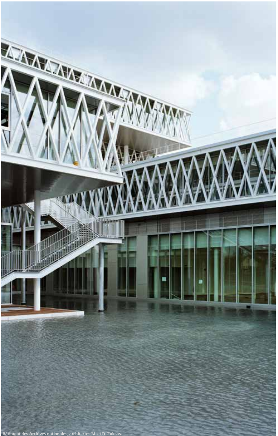
Bâtiment des Archives nationales, architectes M. et D. Fuksas.