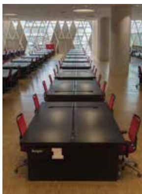
Collecte des archives.