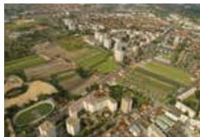
Vue aérienne du secteur des Tartes.

Le poids symbolique de ce service public, la masse d'archives à conserver, l'ampleur des surfaces, la diversité des paysages urbains environnants et de leurs échelles — de l'habitat pavillonnaire du petit Pierrefitte aux grands ensembles du Clos Saint-Lazare — ont constitué autant de défis pour les cinq équipes d'architectes qui ont été appelées à concourir en 2004 par le ministère de la Culture et de la Communication, direction générale des patrimoines, et par l'OPPIC (maître d'ouvrage constructeur du ministère) mandaté pour mener à bien l'opération. C'est le projet de l'architecte Massimiliano Fuksas qui a été retenu en mai 2005 pour la construction de ce bâtiment dont l'avant-projet définitif a été approuvé à l'automne 2007, le permis de construire délivré le 18 juin 2008 et le marché de travaux notifié le 19 mai 2009. Le bâtiment a été livré le 15 juin 2012. Sa mise en service avec ouverture au public a eu lieu le 21 janvier 2013.