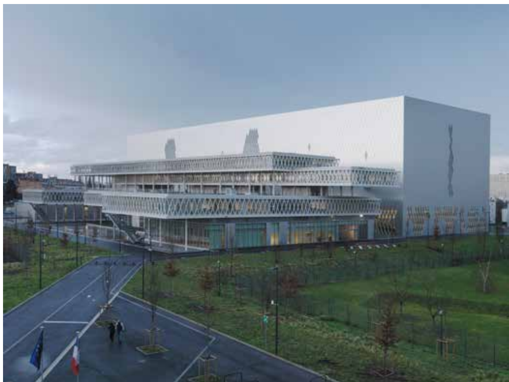
Bâtiment des Archives nationales, architectes M. et D. Fuksas.