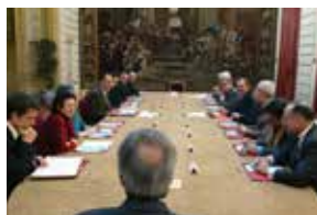
Terrain des Tartres.

Signature du projet de construction du bâtiment de Pierrefitte-sur-Seine par M. Jacques Chirac, président de la République, 9 mars 2004.