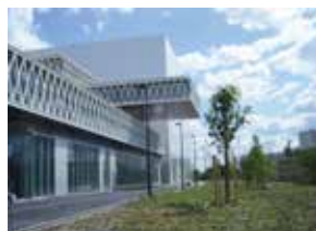
Habillage de la façade du monolithe.