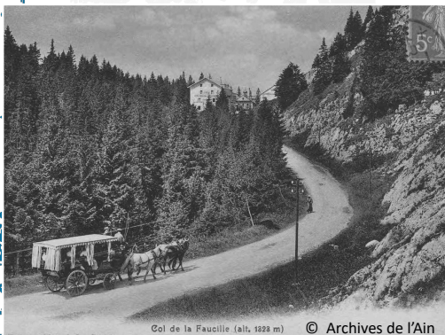
Col de la Faucille (alt. 1828 m)

Le saviez-vous ? Au XIX e siècle, le col de la Faucille servait de poste d'observation boursier ! En 1823, un banquier genevois y faisait guetter la diligence de Paris : un chiffon blanc au fouet du cocher annonçait la hausse de la rente, lui permettant d'acheter avant ses concurrents.