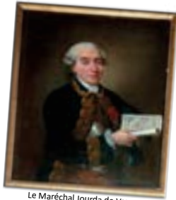
Le Maréchal Jourda de Vaux

La chapelle du Fraisse est le dernier témoignage d'une ancienne seigneurie ecclésiastique. Autour de 1150, les hospitaliers de Jérusalem avaient édifié là une commanderie rurale qui passa aux mains de l'abbaye du Monastier, suite à un échange avec le prieuré des Echelles. Un chemin très fréquenté passait au fond de la vallée du Ramel joignant Bas-en-Basset et Yssingeanx.