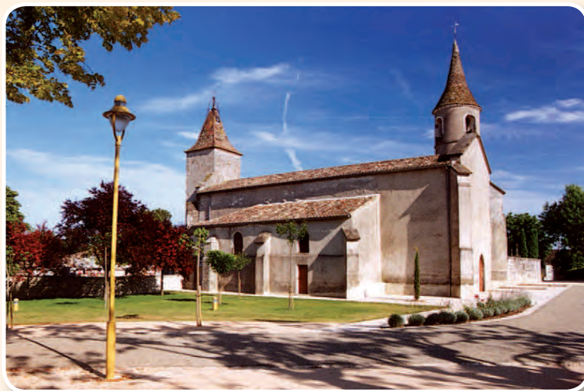
Eglise de Lavaurette ▲

. Vers PR2 St Georges par « Bois des Ramiers ».