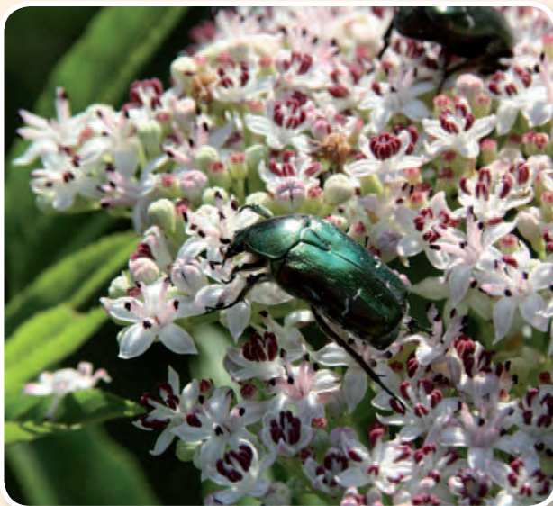
Scarabée doré ▲

A découvrir sur votre chemin : église, maisons de caractère, pigeonniers, pompe à chapelet puits, fermes, gariotte, Natura 2000