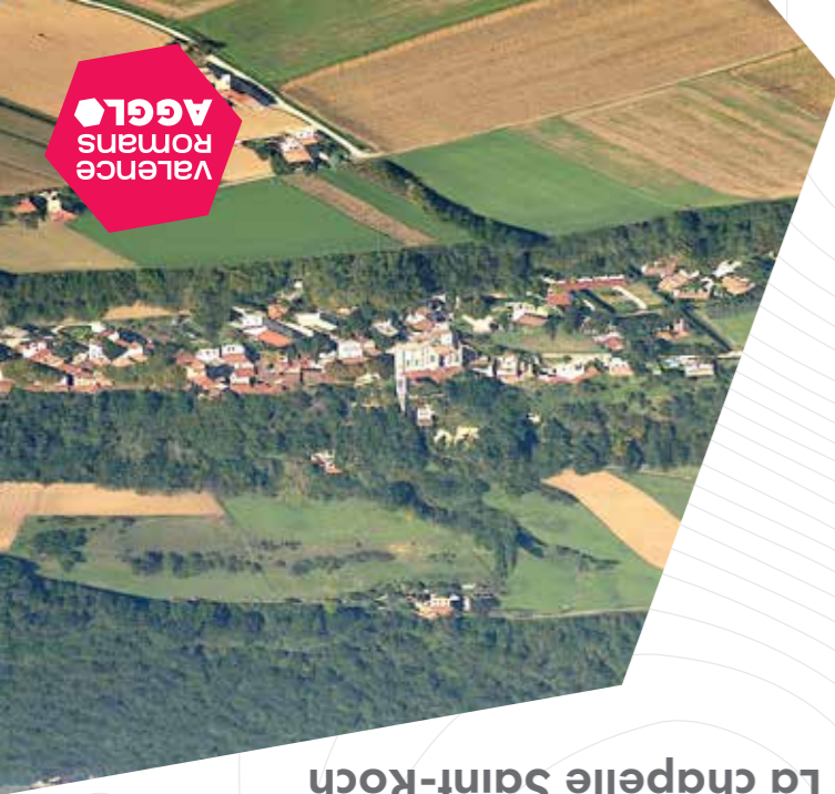
La chapelle Saint-Roch