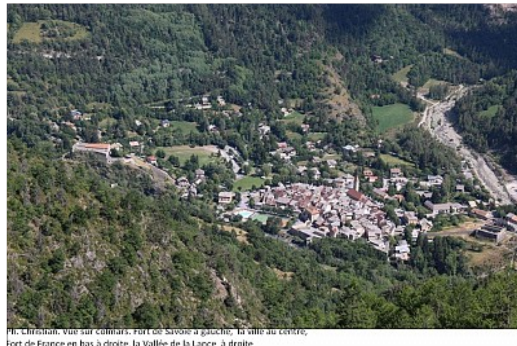
Pl. Christian, vue sur Colmars. Fort de Savoie à gauche, la ville au centre, Fort de France en bas à droite, la Vallée de la Lance à droite