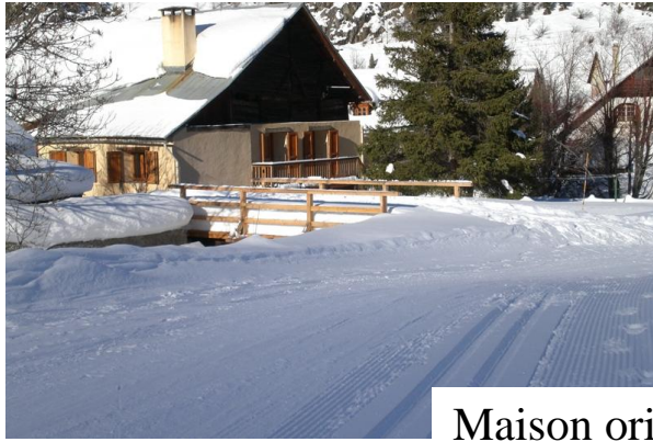
Maison orientée Sud Est, à 20 mètres des pistes de ski de fond.