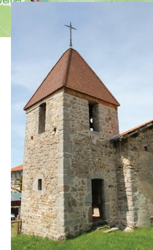
Le clocheton des Biefs

Le nom du village paraît venir de « becié », ou « beciae » qui signifient « bouleau », en patois local.