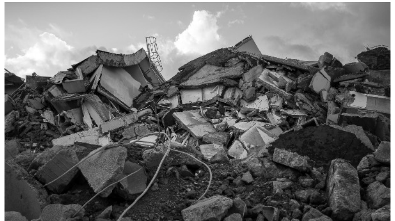
© Sophie Carles « Le dernier souffle » https://sophiecarles.art/