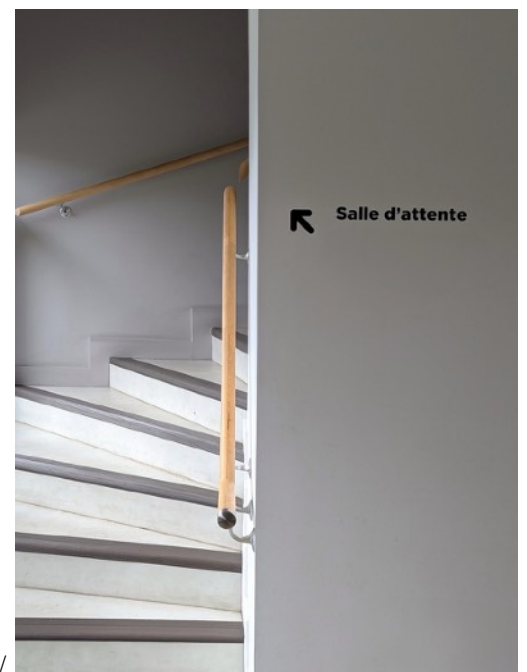
© Isabelle Gallay « La salle d'attente » https://www.instagram.com/isafan33/