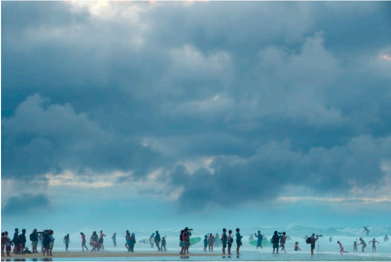
© Pierre Moreau « Transhumance marine » https://pierremoreau.be/