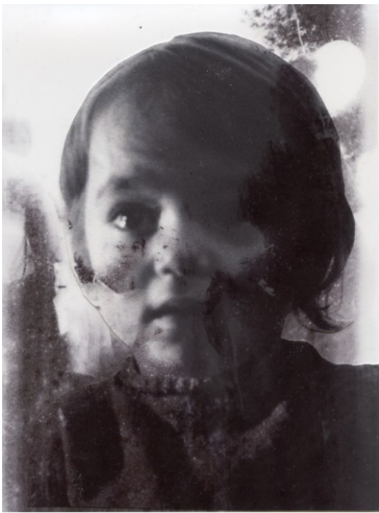
© Myriam Mayet « Les larmes sèches » https://myriammayet.com/