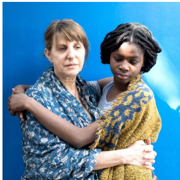
© Anne Landais « Toutes » https://anne-landais.fr/portfolios/relation-meres-filles/