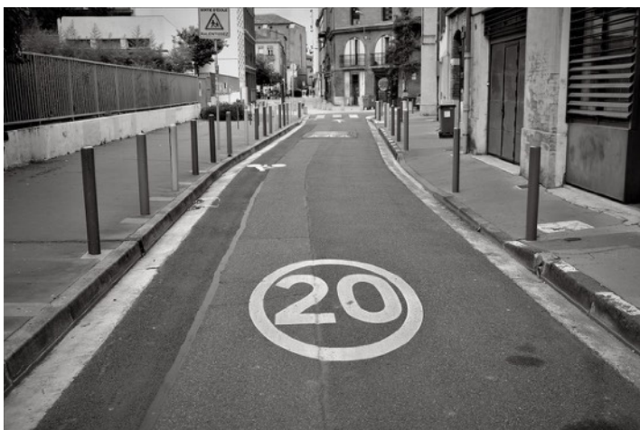
© Pablo Arce « Limitations, chronique du confinement » https://www.pabloarce.fr/