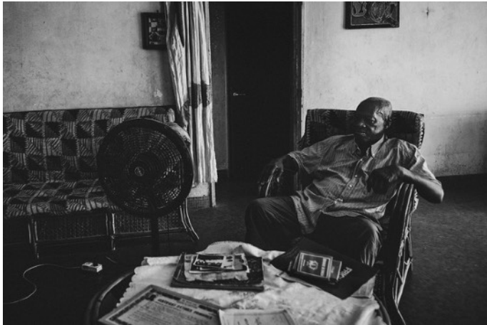
© Alain Licari « L'album de Monsieur Soumah » https://www.alainlicari-photographe.com/