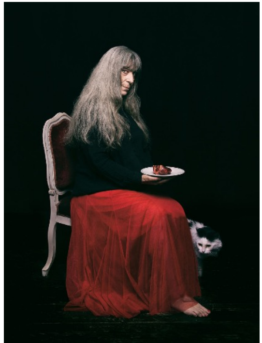
© Carole Tauziat « Conte rouge » https://www.caroletauziat.com/conte-rouge