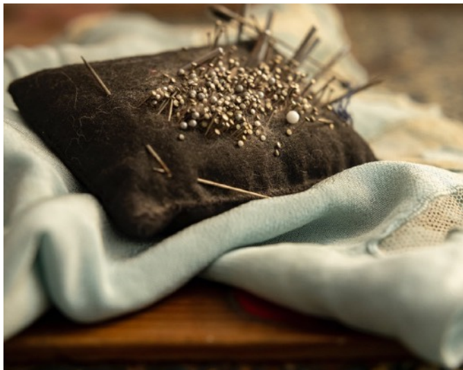
© Brigitte Manoukian « Le lexique de la couturière » http://www.brigittemanoukian.com/galerie-11--le-lexique-de-la-couturiere-.html