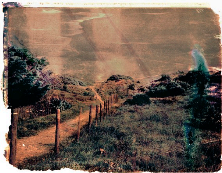
© Valérie Evrard « Fragments de souvenirs » https://www.valerieevrard.com/impression-plan