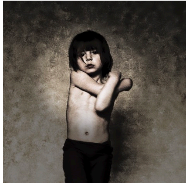
©Justine Darmon « Le clown et la danseuse » https://jdarmonphotographies.com/project/le-clown-et-la-danseuse/