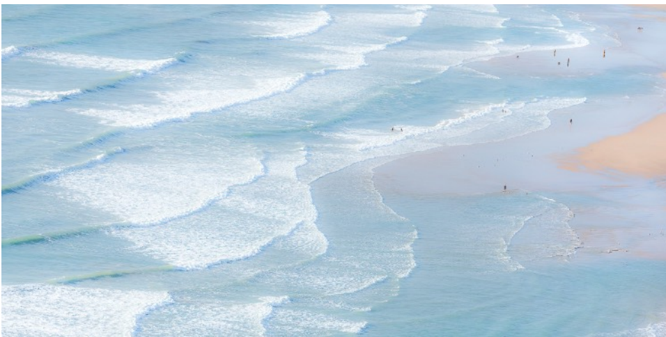
© Francis Leroy « Sable mouvant, songe de plage » https://www.imag-in-air.com/