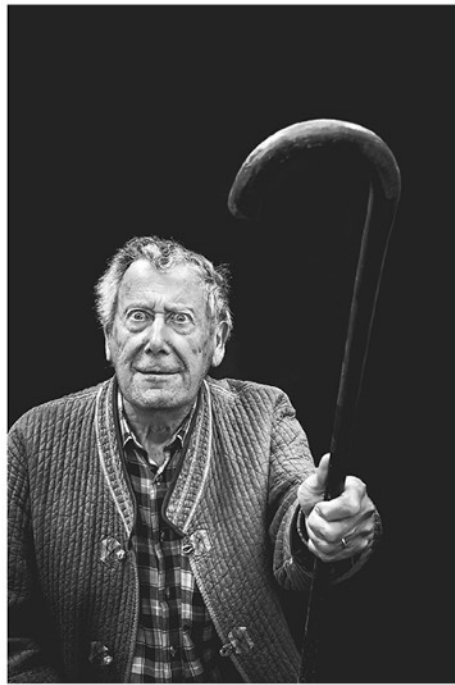
© Véronique Durand-Nemo « Le temps ne fait rien à l'affaire » https://veronemo.myportfolio.com/le-temps-ne-fait-rien-a-laffaire