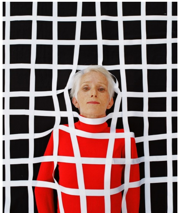
© Estelle Lagarde « La peau des autres » http://estellelagarde.com/galerie-la-peau-des-autres.html