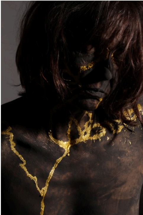
« Résilience » https://www.facebook.com/profile.php?id=100013581428924