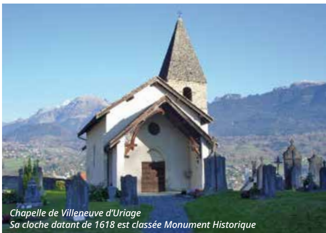
Chapelle de Villeneuve d'Uriage Sa cloche datant de 1618 est classée Monument Historique