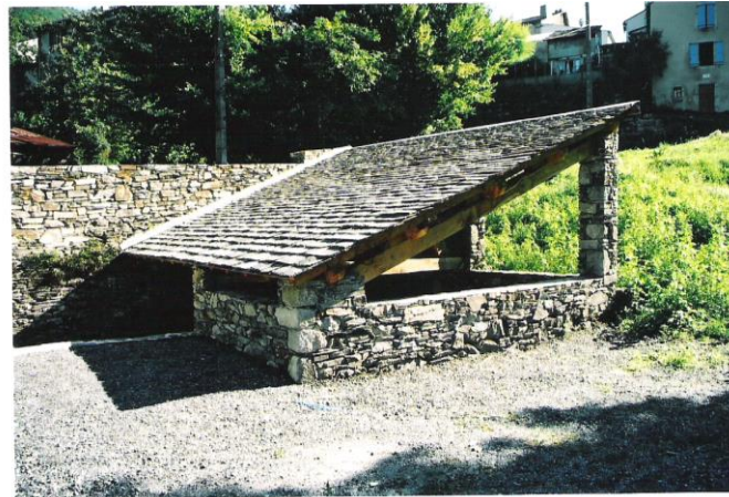
Le lavoir de Vabrèz