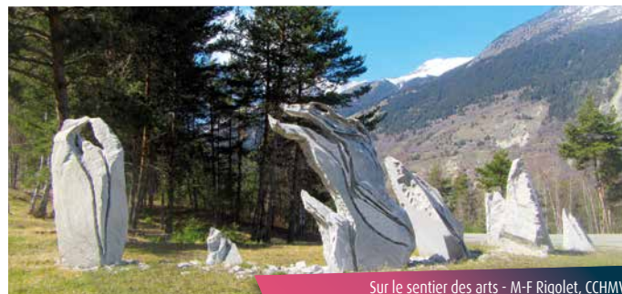
Sur le sentier des arts - M-F Rigolet, CCHMV

L'idée d'un safari imaginaire vous incite à entamer la première grimpe en forêt. Rapidement éloignés de la route, vous avancez de rencontre en rencontre. Toutes de blanc vêtues, les statues qui ornent votre chemin semblent vous souhaiter une à une la bienvenue. Portés par l'odeur des épicéas qui libèrent leur résine, direction les Avenières et sa bulle de fraîcheur !