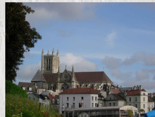
Meaux : Photo CD ©

Cette randonnée vous fera découvrir le vieux Meaux, avec ses joyaux : la cathédrale St-Etienne, le Palais épiscopal, le jardin de l'archevêché et le musée Bossuet. Le parcours est ensuite très bucolique avec le canal de l'Ourcq et les espaces naturels du Brasset. Après la visite du Musée, retour par les hauteurs où vous pourrez profiter de beaux points de vue sur Meaux et sa cathédrale."