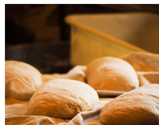
Les Champs du pain

ou sur la carte touristique Chartreuse (disponible gratuitement dans les offices de tourisme du massif).