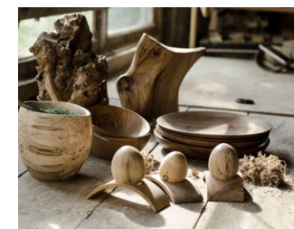
Peter Pan Bois