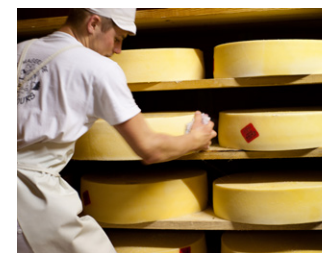
Coopérative Ici en Chartreuse