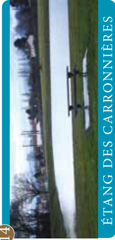
ÉTANG DES CARRONNIÈRES