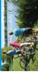
BASE DE LOISIRS DE BOUVENT