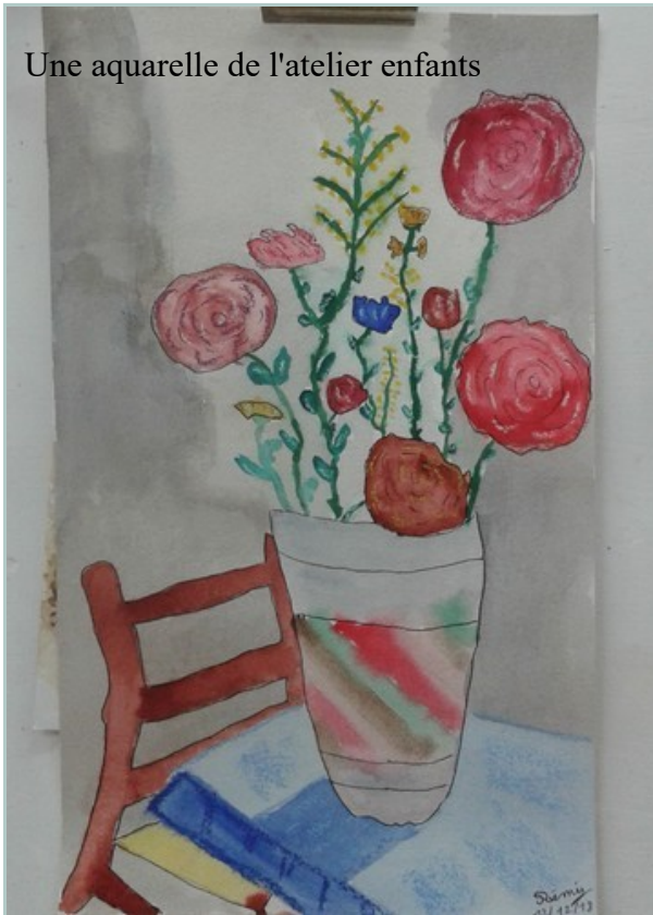
Une aquarelle de l'atelier enfants