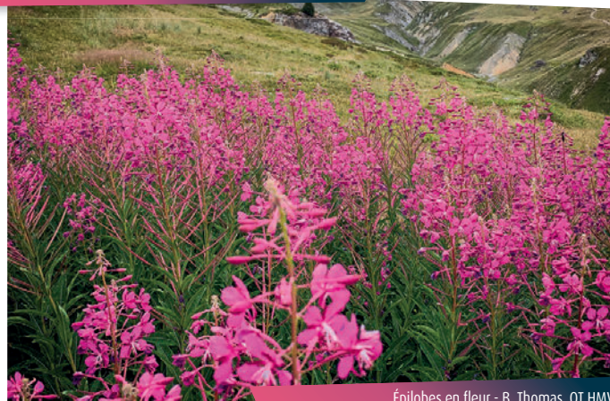
Épilobes en fleur