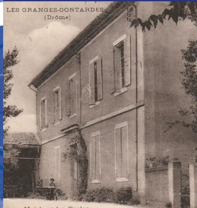
LES GRANGES-GONTARDES (Drôme)