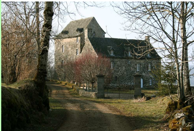
le château de Ferluc (XIVème - XVIIème siècles)